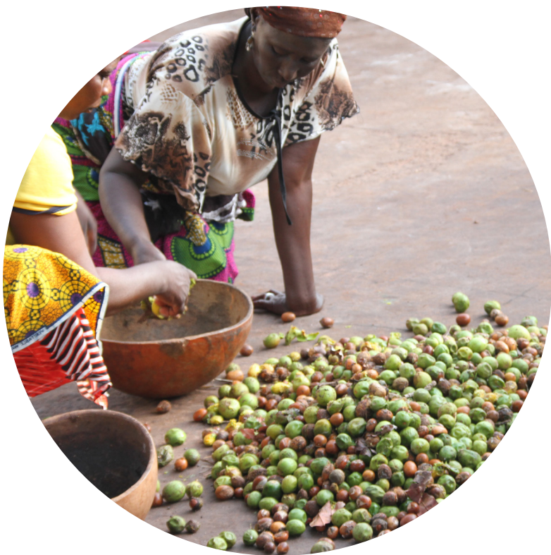
Global Shea Alliance